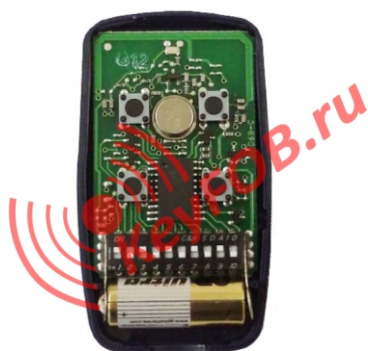
Пульт ДУ Nice FLO4, дип-переключатели.

Для записи кода Пульты Nice FLO в универсальный приемник серии OX, читайте инструкцию по эксплуатации приемника.