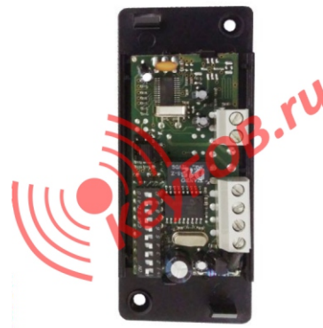
Внешний радиоприемник Nice FLOX1, дип- переключатели.

СОДЕРЖАНИЕ ДАННОГО РУКОВОДСТВА НЕ МОЖЕТ ЯВЛЯТЬСЯ ОСНОВОЙ ДЛЯ ЮРИДИЧЕСКИХ ПРЕТЕНЗИЙ!