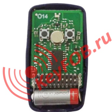
Пульт ДУ Nice FLO2, дип-переключатели.

Для записи кода Пульта Nice FLO в универсальный приемник серии OX, читайте инструкцию по эксплуатации приемника.