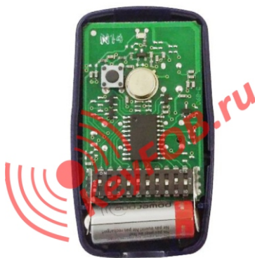
Пульт ДУ Nice FLO1, дип-переключатели.

Для записи кода Пульты Nice FLO в универсальный приемник серии OX, читайте инструкцию по эксплуатации приемника.